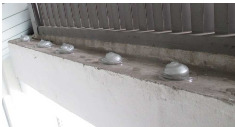
屋内用カップにバードヘイト塗布