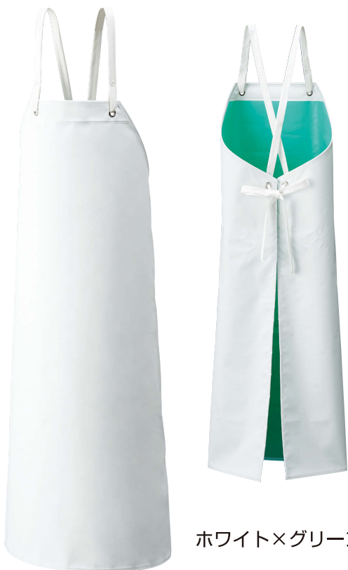
ホワイト×グリーン