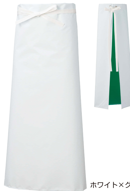
ホワイト×グリーン