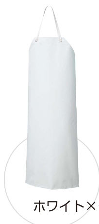
ホワイト×グリーン