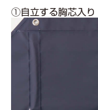
①自立する胸芯入り