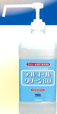
1000 ml (標準タイプ)