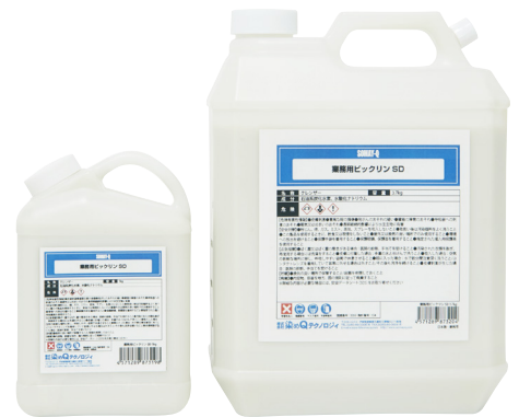
左:1kg / 右:3.7kg