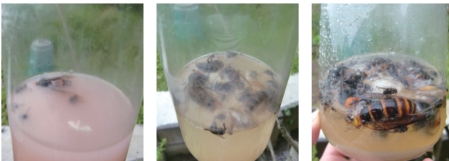
発酵が進むに従い、ハエ、蛾を捕獲。その後スズメバチが入り始めます。